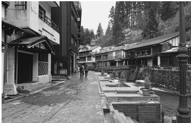
当面の間、休業となります(銀山温泉)

町長 対策本部を設置し、取り組んでいる。情報の即時性の観点から特にホームページによる最新情報の提供を行っていく。教育長 国や県からの依頼を受け、感染リスクに予め備える観点から、小中学校ともに卒業式まで臨時休業をすることに決定した。日々状況が変化し、追加的な対応も予想されるが、知恵と勇気を結集し乗り切っていく。