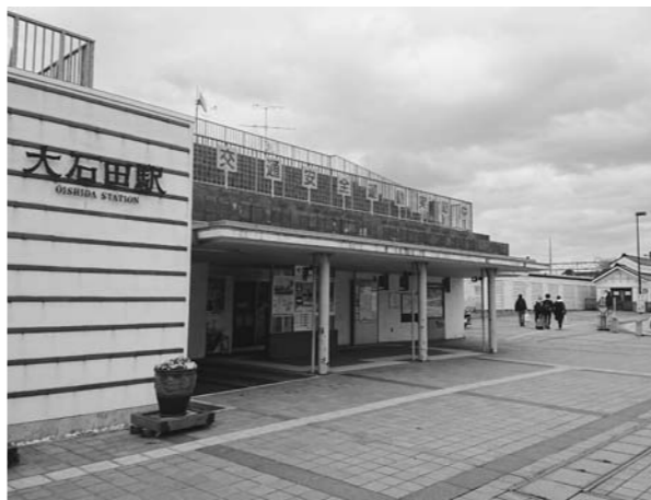
観光客も学生もいない(大石田駅)

町長 3月4日に感染症対策本部を設置し、6日に第2回本部会議を開き、当面の対応を決めている。町長 各地区的総会のやり方がそれぞれ異なっている。町で強制的に指示することは難しい。感染しないように十分に注意してほしい。