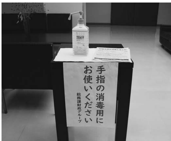
消毒はこまめにしましょう(役場内)

教育長 この1年間、県内の多くの学校で試行錯誤してきたのではないかと。当町では4月から客観的な把握に対応する。