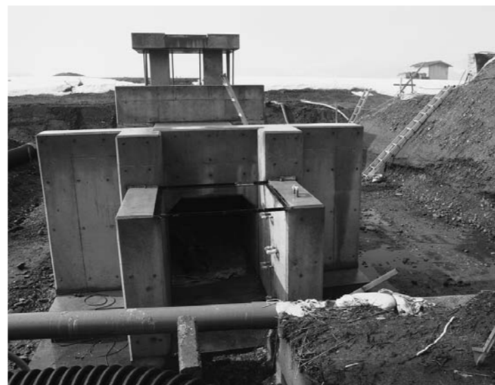
全町に流雪溝整備を(鷹巣流雪溝流末施設)

建築士等技術職の採用は、町長 必要性はかねてから感じる。職員配置や担当事務のバランスを考えていく。 町長 借金は増加するが、以前も15年で30億ほど減らしたように返済はしていく。今後も振興実施計画に沿って、健全財政を維持しながら事業の具現化をしていく。