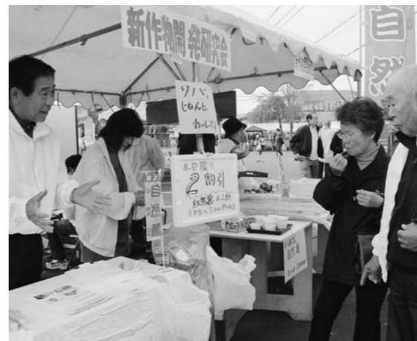
好評な自然薯販売(そばまつり)

世帯は105で県内転出は8割をしめる。改善をどう図るのか。町長 アンケートで転出の理由は「雪」が85%の回答だった。 「克雪対策」を第一に、子育て支援や経済対策を実施していく。 そば・スイカや自然薯などで農業所得を増やすことが定住につながるかと考える。 町長 農業関係者と話しあいながらやっていきたい。販売は先頭に立ってやっていく。