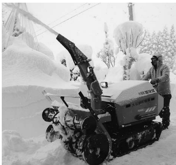
大活躍の小型ロータリー