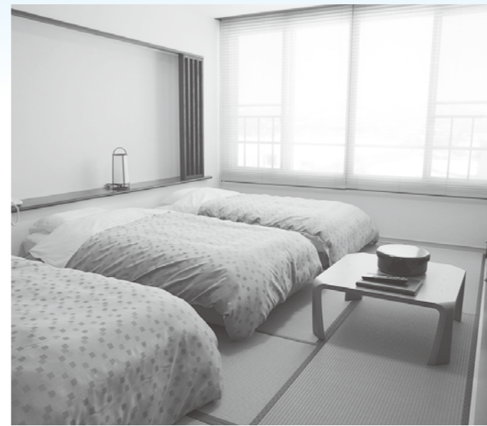
ベッドルームの稼働も上々!?

副町長 温泉館の入湯者に大きな変動は無いが、虹の館がリニューアルのために休館したこともあり、赤字の決算になる見込み。