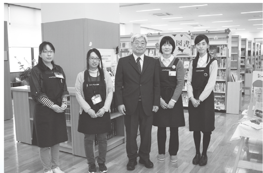
新館長のもと、皆様のご来館をお待ちしています。