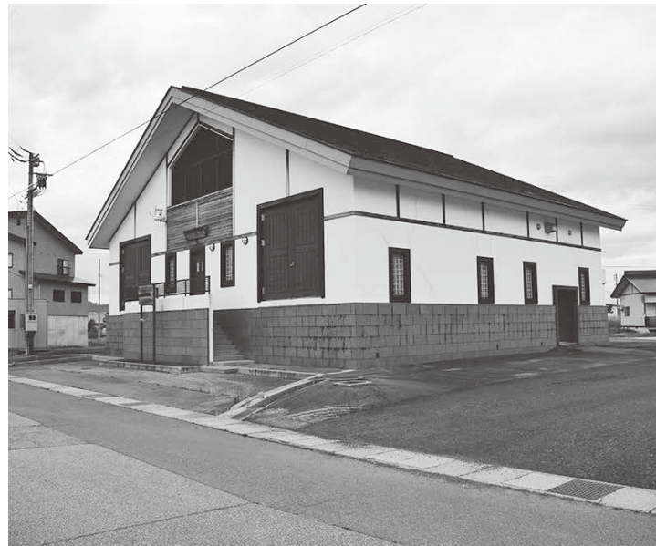
やっぱり頼みの綱は最上川からか。(揚水機場)

水 利使用許可申請に500万円ほど補正予算があることは流雪溝整備に一步近づいたと思うが。