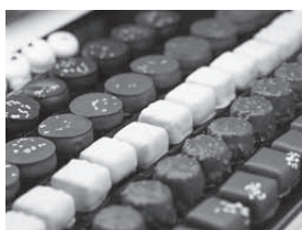
一つ一つに心を込めて