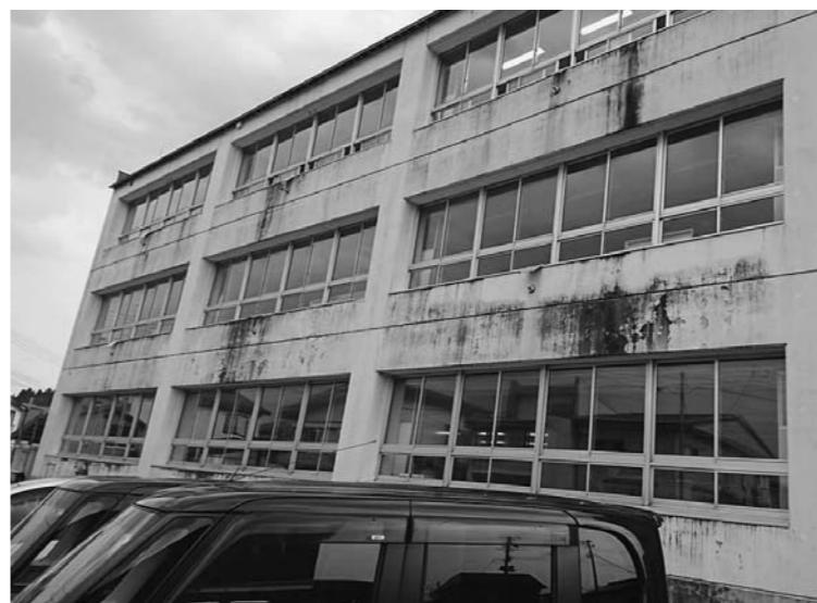
黒染みが年々広がっている外壁

大石田小学校の外壁が老 朽化している。設備や備 品など、教育環境を整備 する計画はあるのか。 教育長 大石田小学校校 舎は、建設から27年が経 過しており、老朽化に伴 う維持補修が必要になっ ている。町長部局と協議 しながら、劣化状況等の 調査も含め対応を検討し ていく。