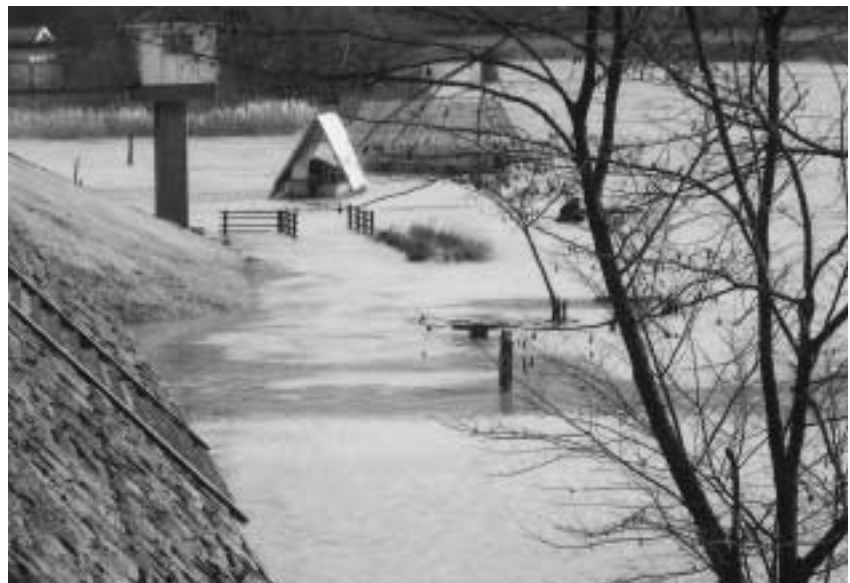
昨年12月27日の増水（舟着場）

大規模災害への対応を早くから準備を 町長 中学校建設は財政状況が厳しいが、教育委員会の考えを受け、平成22年度開校に必要な対応をしていきます。保育園は園児や保護者の心情を考慮し、一日も早く除去工事に着手し、安全・安心な保育業務をするのが責務と考えます。施設整備や過疎債など有利な財源を確保し、一般財源を最小限に抑えます。