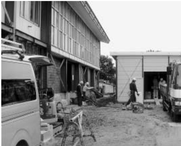
ふたば横山保育園代替施設（横山地区総合センター）

耐震強度不足やアスベストから、子どもの命を守るう 耐震強度不足の校舎やアスベスト建材使用の保育園で、子どもと教師・保育士の命が危険にさらされています。この危険を取り除くため、中学校の建設と保育園の改修を一刻も早く進めるべきではないでしょうか。