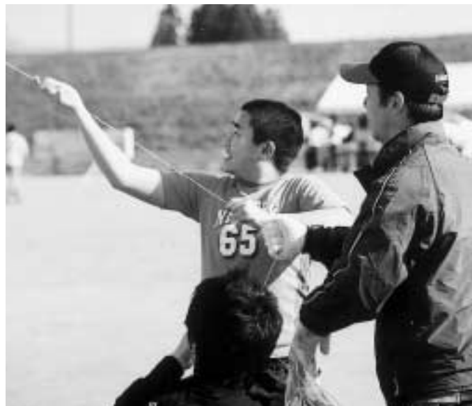
凧あげ大会（下河原）

対策はどうするのか。 町長 町民への公平なサービスを行い、公平公正な負担をしてもらうのが大原則です。今後とも納入督促をしながら、分納指導も図り、徴収に努力していきます。 子どもの放課後の居場所はどうなっている 子どもを巻き込んだ犯罪に不安が広がるなか、大人の目が届いているか心配です。 教育長 文部省と厚生労働省が統一的に事業をすることにしました。土曜・日曜におこなう「子ども教室」と、平日おこなう「児童クラブ」です。児童クラブは、ふたば児童館がおこなっていますが、子ども教室は、月2回土曜日に町内ボラン