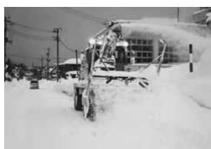
冬道を守る除雪作業