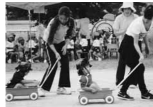
ふたば横山保育園運動会より