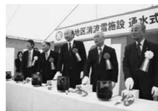
待望の通水式を迎えた横山地区流雪溝