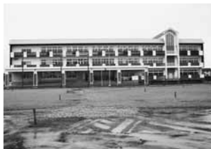
完成した統合中学校