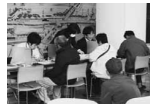
定額給付金の申請受付