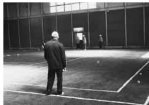
人工芝が張られた桂桜会館多目的コート