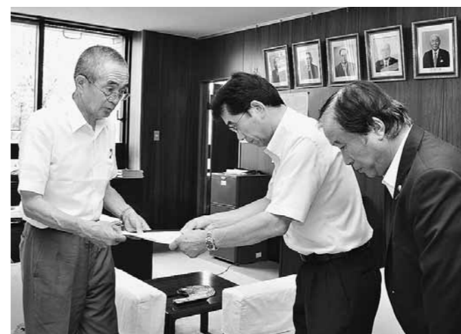
町長に意見書を提出