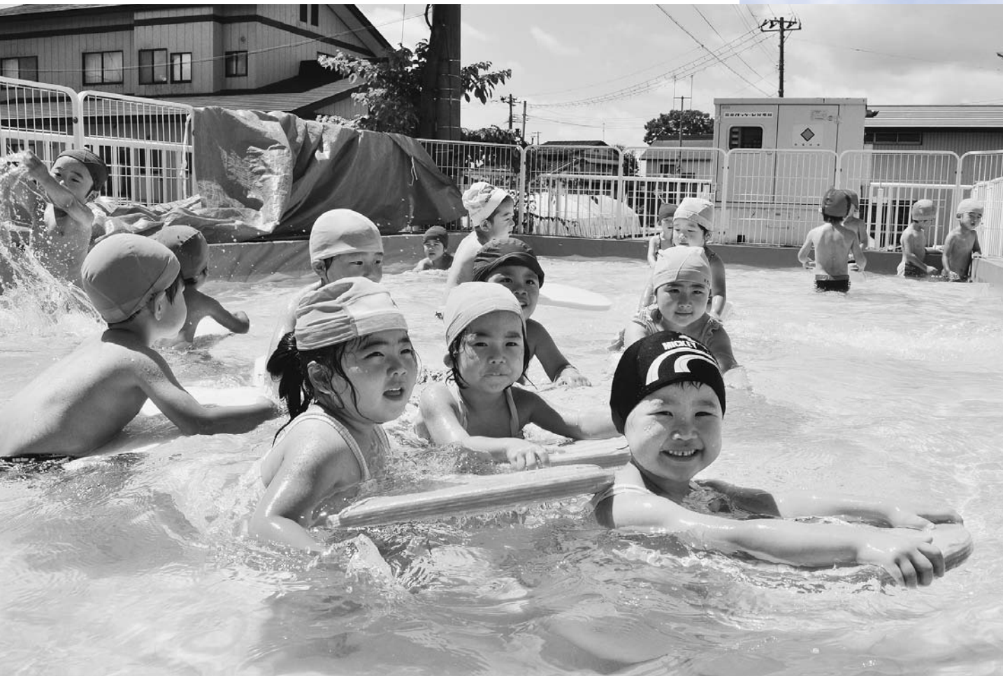
水あびする ふたば保育園児

山形県大石田町ホームページ http://www.town.oishida.yamagata.jp