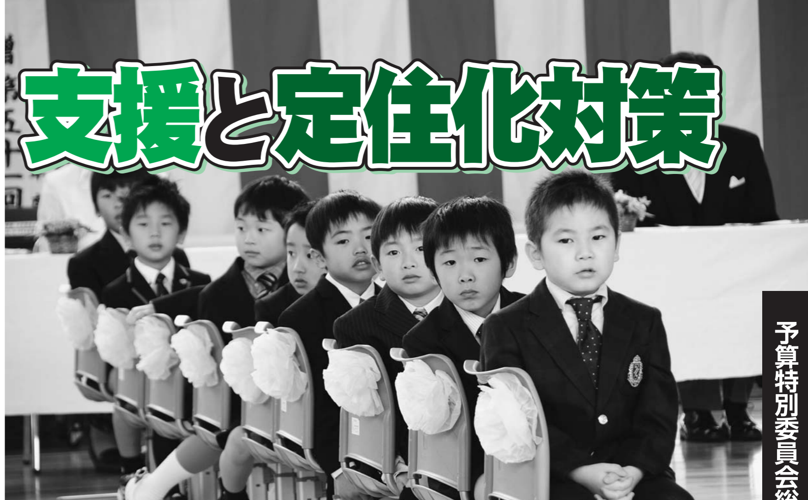
大きく育て町の宝