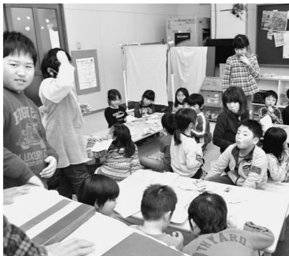
ぎゅうぎゅう詰めの子どもたち

副町長(振興公社社長) 子どもが喜んで入るようなものにしたいと考え、見本を2、3作っているが、まだ形が決まっていない。焼き上がるまで1ヶ月半かかるが、配管や設置工事も含めできるだけ早く対応したい。