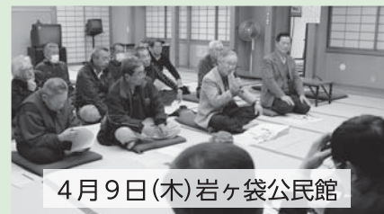
4月9日(木)岩ヶ袋公民館