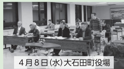
4月8日(水)大石田町役場