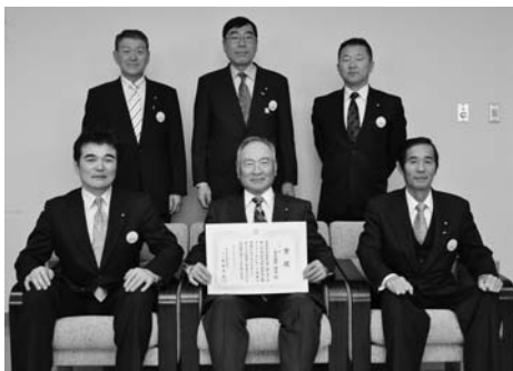
町民に愛される議会だよりを目指します

議会だより140号が第20回山形県町村議会広報コンクールにおいて、2年連続の入選を果たしました。審査委員からは、「住民の関心が高い政策課題を強く押し出し、審議内容が紙面化されて議会の存在感を示している。読者にわかりやすい見せ方、読ませ方は「一級品」との評価をいただきました。