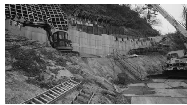
復旧工事が急ピッチ（平成27年4月13日）