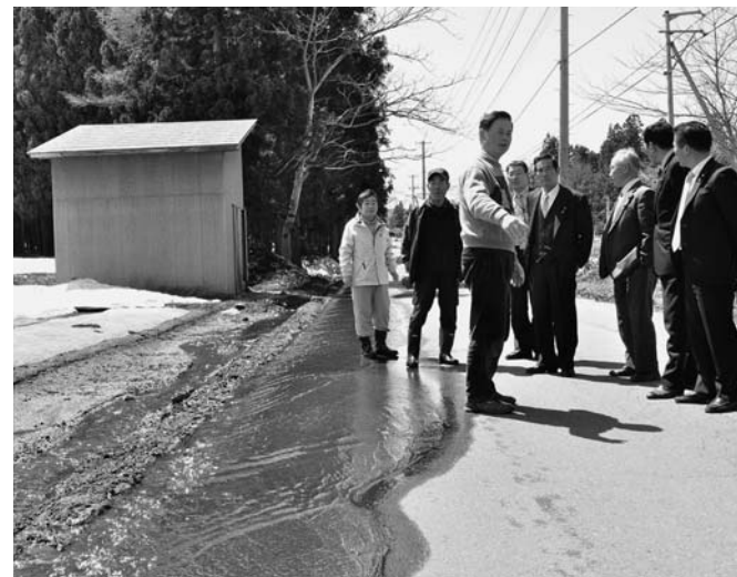
溢れる雪解け水（平成25年4月15日）

議会では政策提言書にも載せて、町に早期解消を強く要望してきました。これを受け町でも26年度工事で側溝を整備したことで右の写真のように道路に水が溢れることもなく危険が解消されました。議会では今後とも町民の皆さんの声が町政に反映されるよう全員で頑張りますので、ぜひ皆さんの声を届けてください。