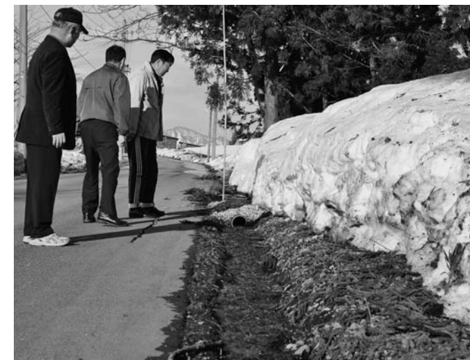
危険が解消された町道（平成27年3月26日）

町道岩ヶ袋・荻袋線はわが町から尾花沢市の工業団地へアクセスする重要な幹線道路で通勤車が非常に多い道路です。側溝が未整備なうえ、勾配があるため春の融雪期には雪解水が溢れ、さらに低温時には凍結してスリップ事故等が発生する大変危険な道路でした。25年度の議会と町民との懇談会の席でも地元岩ヶ袋区長から解消策を強く要望されました。