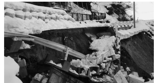
全面通行止めの町道白鷲線（平成26年1月15日）