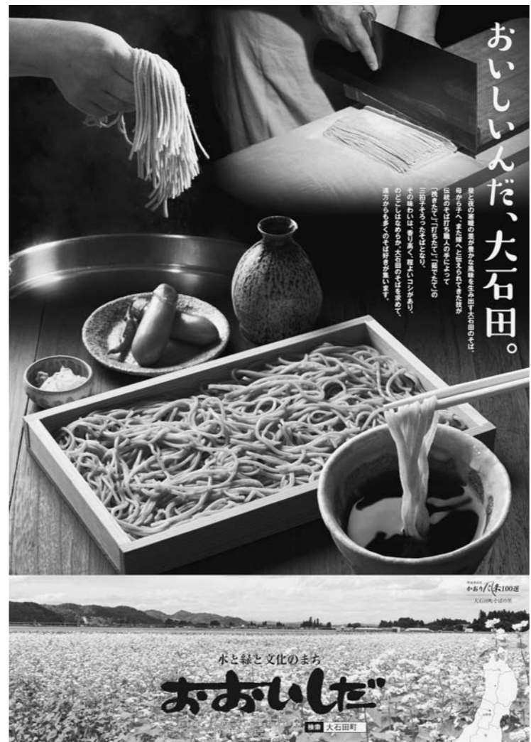
ポスター刷新！さらなる誘客をはかれるか？

そ ばが不作だが、来迎寺在来種は町内需要量に間に合うのか。産業振興課長 町内のそば屋で使う量は足りない不足分は各店に対応していただく。