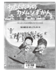
「わたしたちのカムシずかん」