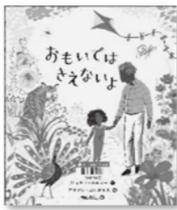
「おもいでではきえないよ」

本を読んでおもしろかったこと、感動したことを文章で書いて伝えてみませんか。町立図書館では所蔵のある課題図書を貸出しています。