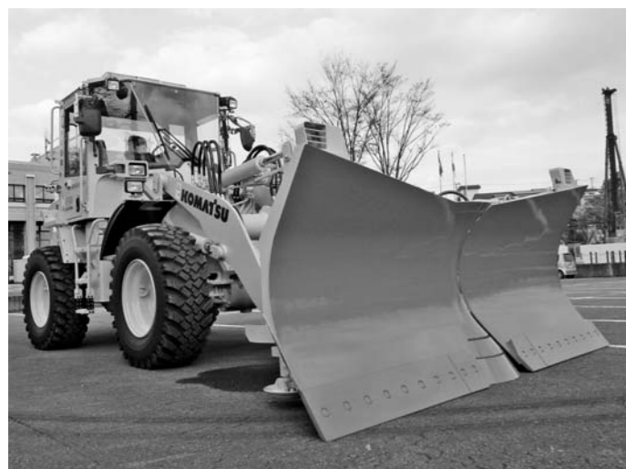
タイヤ10本分で208万円

タ イヤの交換状況は、建設課長 台数が17台あり、今年度は車検が8台、3台が交換しなければならぬ。