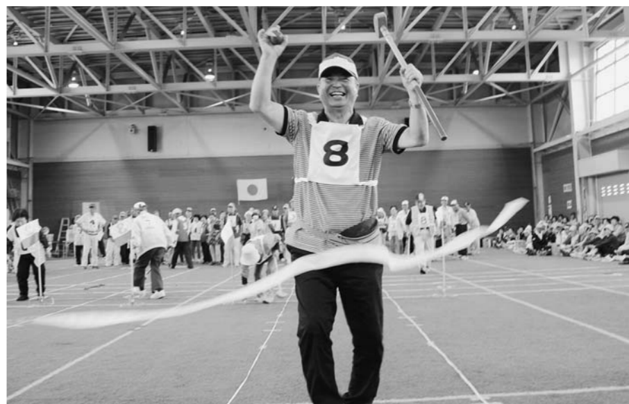
元気いっぱい老人クラブ