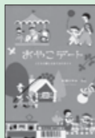
杉浦 さやか著 / 白泉社刊 『おやこデート こどもと楽しむおでかけガイド』