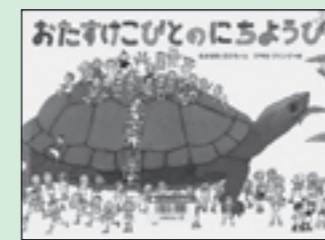
なかがわ ちひろ文 / 徳間書店刊 『おたすけこびとのにちようび』