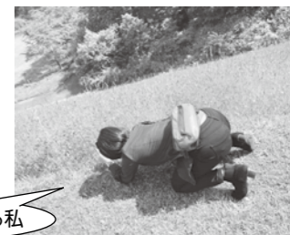
スマホで写真を撮っている私

大石田に引っ越して3ヵ月ほどですが、不安や戸惑い以上に楽しいことばかり!この新鮮な気持ちや、毎日元気で超☆ハッピー、みたいな姿を見て頂くことで、大石田のみなさんの笑顔や、何かを感じたり考えたりするきっかけになれたらいいなあ。これからお騒がせすることが多々あるかと思いますが、どうぞよろしくお祈りします!!