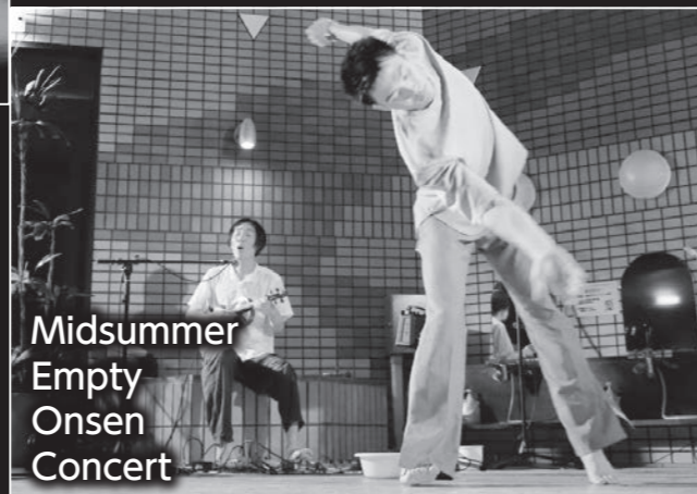
Midsummer Empty Onsen Concert