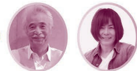
ゲスト:さとう宗幸