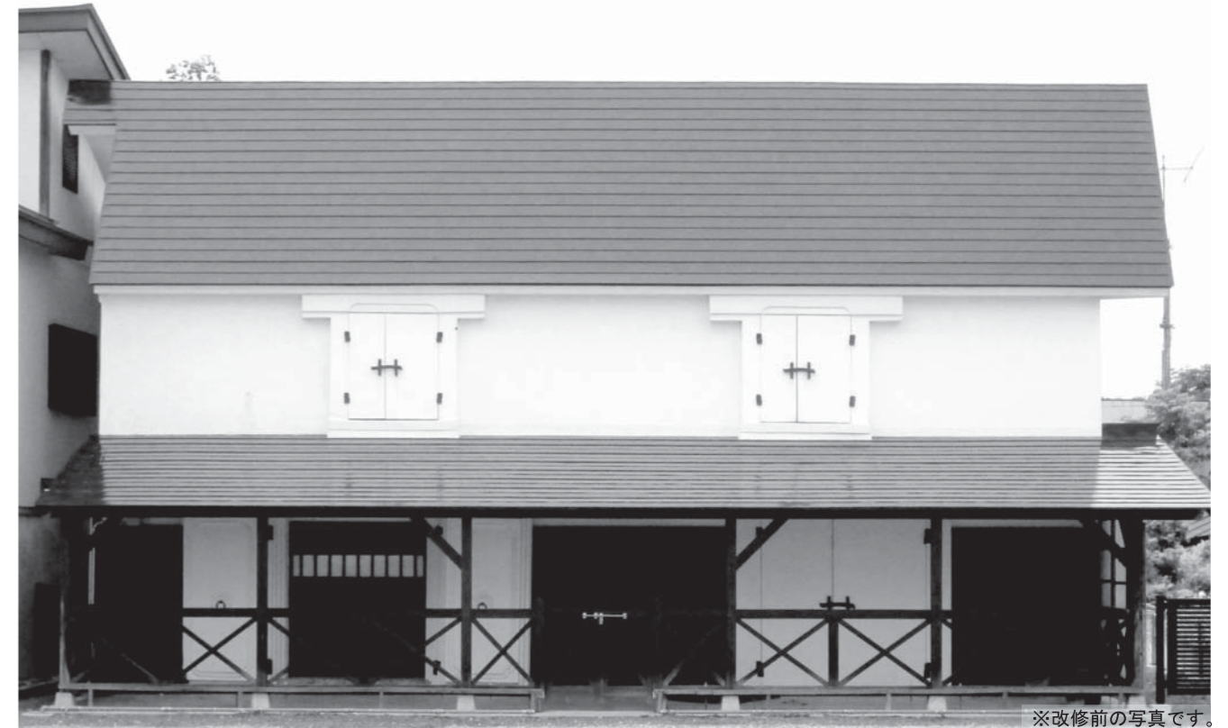
※改修前の写真です。

現在改修工事を進めている「大石田駅前賑わい拠点施設」がまもなく完成し、8月9日にオープンします。「継続的な来町者の増加」や「交流人口の増加」を目指し運営していきます。