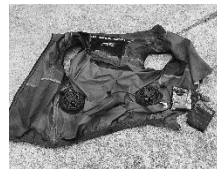
(写真:発火した空調服)

空調服(ファン付きウェア)による処分作業中の発火が発生しています。必ず下記のとおり分別して収集日に排出してください。 ①衣類部分(衣類) ②ファン部分(処理不適物) ③バッテリー部分(乾電池類) に必ず分別してください。 ■尾花沢市大石田町環境衛生事業組合 環境衛生課 ☎(25)2737