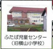
ふたば児童センター (旧横山小学校)