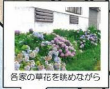
各家の草花を眺めながら