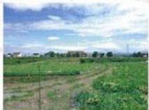
スイカ畑が広がる