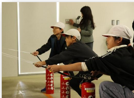
山形市防災センターで防災学習！