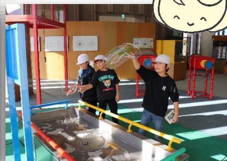
体験・実験をしながら科学を学ぼう