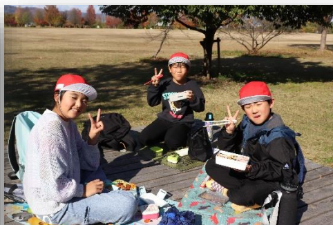
絶好の天気でおいしい楽しい西公園