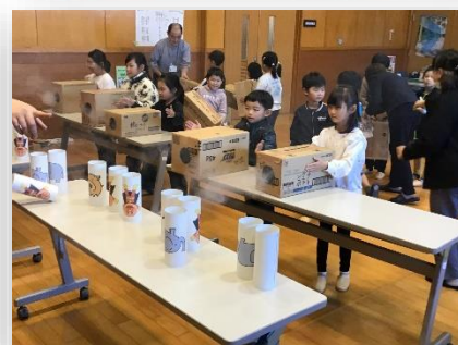
科学も工作もおもしろい！