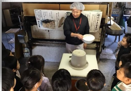
「ふ」って「ふしぎ」でおいしい！