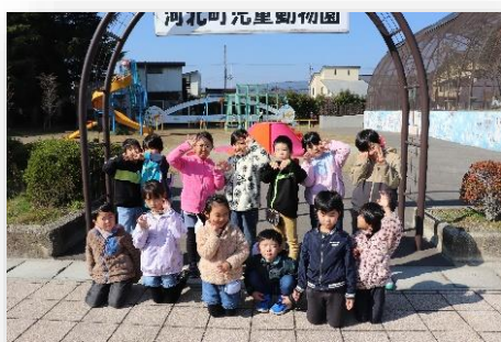
動物とふれあった河北児童動物園