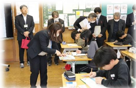
6年生算数授業研究会「反比例」

冷え込みが強まる毎日ですが、子どもたちは仲間と力を合わせながら、意欲的に学び続けています。その姿に、私たちも日々励まされています。今後も、子どもたち一人ひとりの学びを大切にしながら、学校全体で温かく成長を支えてまいります。保護者の皆様、地域の皆様には、変わらぬご理解とご協力をよろしくお願いいたします。