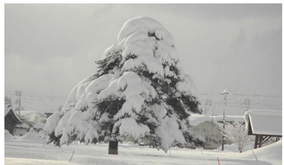
大小「スノーモンスター」