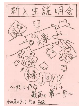
(新入生説明会パンフレット表紙)

子どもたちは、大石田町の皆さんにあたたかく見守られ、励まされ、認められながら成長していく中で、中学生として下級生の手本となりリーダーシップを発揮しなければならないこと、一人の町民として地域に貢献する姿勢をもつことへの意識を自然に高めているように感じます。生徒数は減少していますが、これからも地域のみなさんとともに、大石田中生の活力ある存在感を発揮していきたいと思えます。