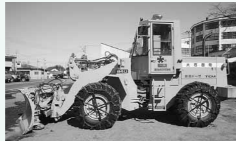
除雪機械整備事業