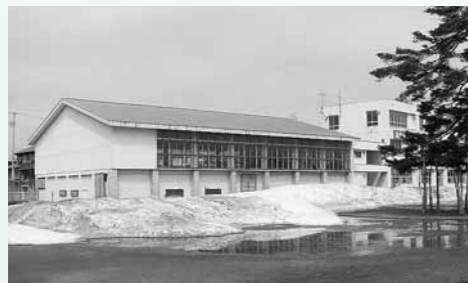
大石田小学校 体育館耐震化事業

財政状況が厳しいなか、22年度もいろいろな事業が予定されています。そのうち主な新規事業をピックアップしました。