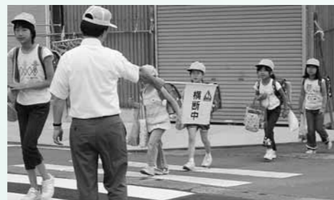
地域ぐるみの学校 安全体制整備事業