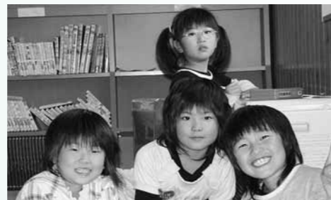
子ども手当 支給事業

町管理の老朽化した防犯灯をLED電灯に改修し、電気料節減・CO2削減をするものです。