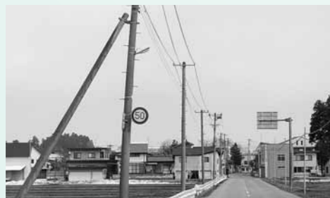
地球環境保全 対策事業

町管理の老朽化した防犯灯をLED電灯に改修し、電気料節減・CO2削減をするものです。