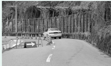
町道白鷺線 災害防除事業