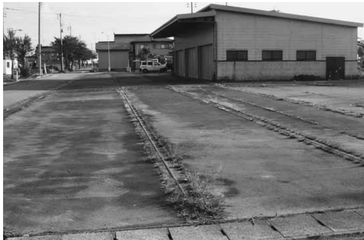
スクールバスの駐車場