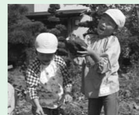
子どもの笑顔は町の笑顔

高齢者や、障がい者が健康で生き生きと暮らせる町、子どもを安心して育てられる町を目指します。