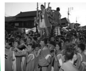
活気あふれる大石田祭り

基幹産業の農業振興に努めるとともに、観光・交通機能の充実に努め、活力ある産業の町を目指します。