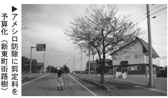
▶アメシロ防除に剪定料を予算化（新東町街路樹）

■大石田町福祉会館使用料条例の一部を改正する条例の制定について (全員賛成で可決)