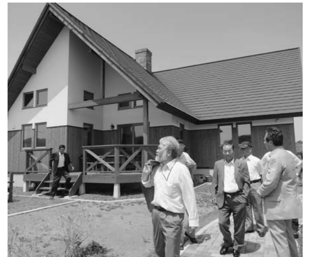
優良田園住宅のモデルハウス

新千歳空港から車で30分、主要都市へのアクセスに優れ降雪も少なく道央の食糧基地を自負する由仁町を訪問した。平成7年に農地流動化の調査を実施、後継者不足など離農者が多数存在することが判明、約500haの農地が遊休することがわかった。 由仁町に緑のある札幌在住の方々から、500坪程度の家庭菜園ができる住宅で定住したいニーズもあり、過疎の解消や農地荒廃防止に有効利用が必要と判断、平成10年