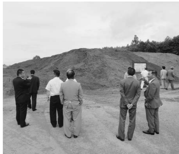
パーク材で覆った雪山

北海道の沼田町は人口約3400人、予算額40億円、累計降雪量11m、基幹産業水稲農業の町。「輝け雪の町」を宣言し、克雪・利雪・親雪、さらに雪自体についてや雪国の暮らしを学ぶ「雪雪」のテーマのもと雪と共生するまちづくりを目指している。やっかい者の雪の活用、雪のエネルギー利用、雪でまちを元気にのも雪を地域資源として活かす取り組みをしている。