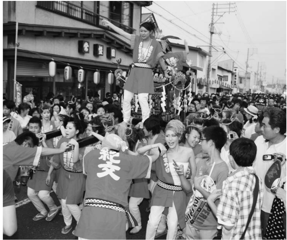
大勢の見物客で賑わう大石田まつり