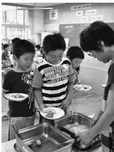
おいしい給食をおかわり (大石田小3年生)

庄 雪車は価値のあるうちに売却してはどうか。教育長 今後検討しなければならぬと思う。