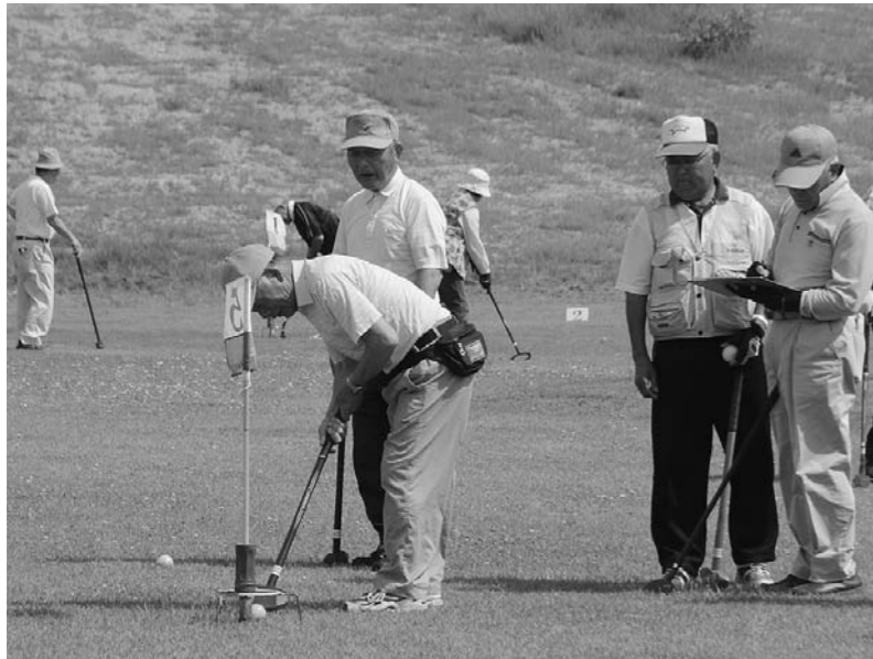
健康づくりにグラウンド・ゴルフ