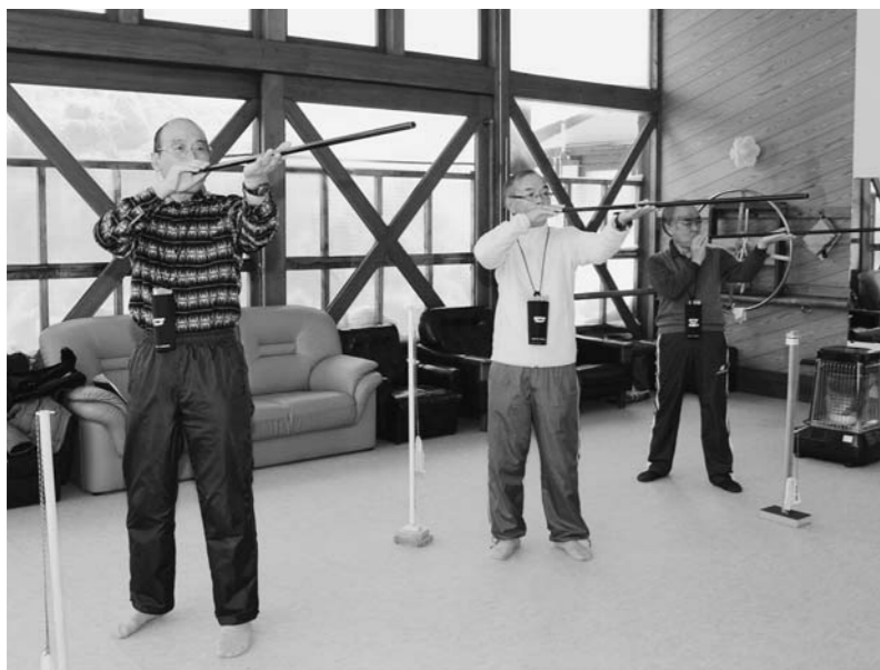
スポーツ吹矢(町民1人1スポーツ)