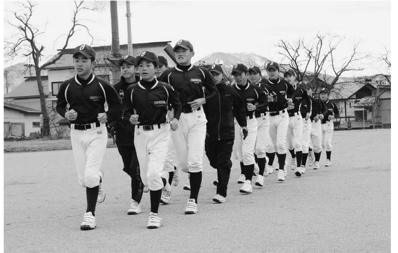
町ぐるみで応援 中学校部活動