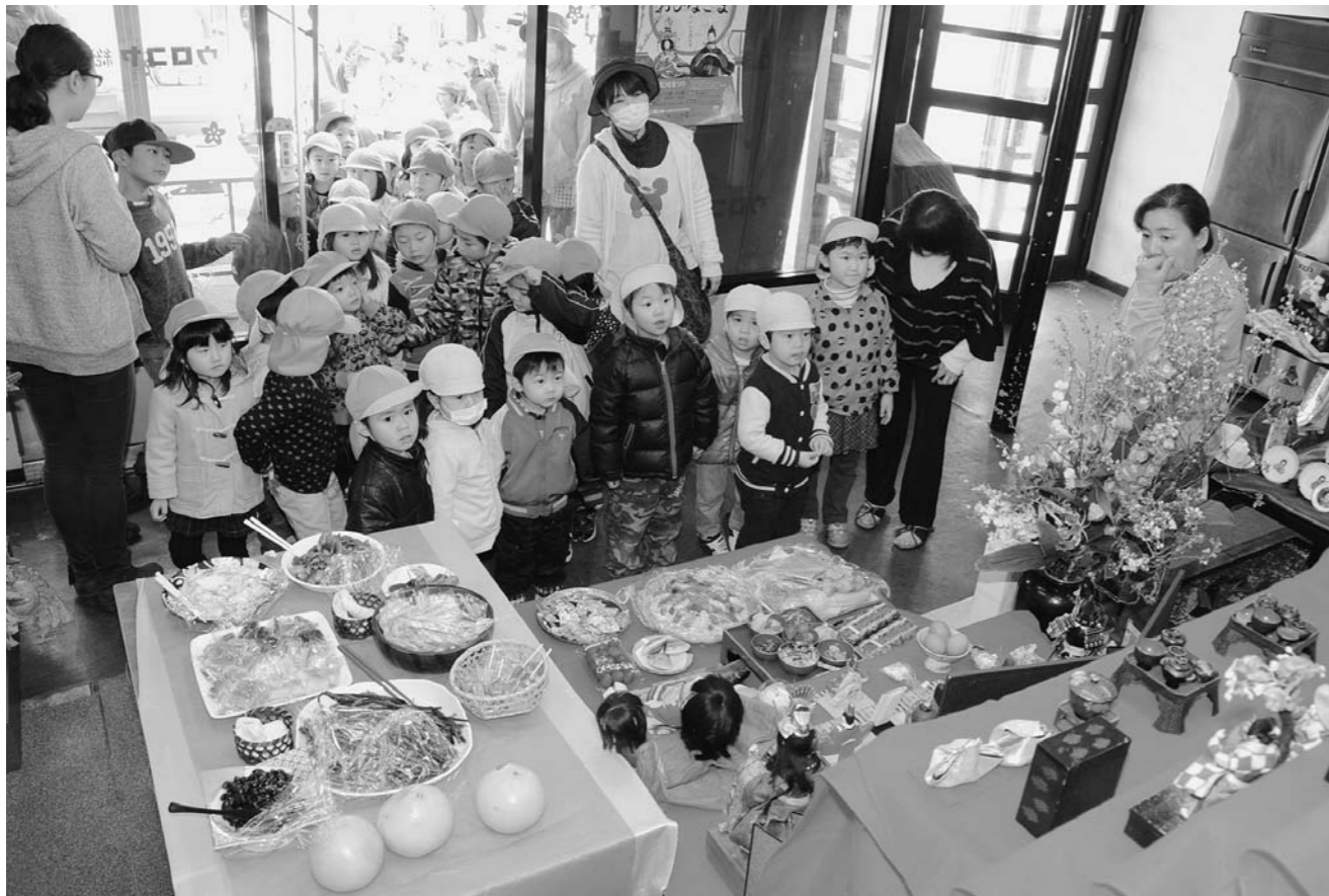
60周年記念のひなまつり(4月2日、3日)