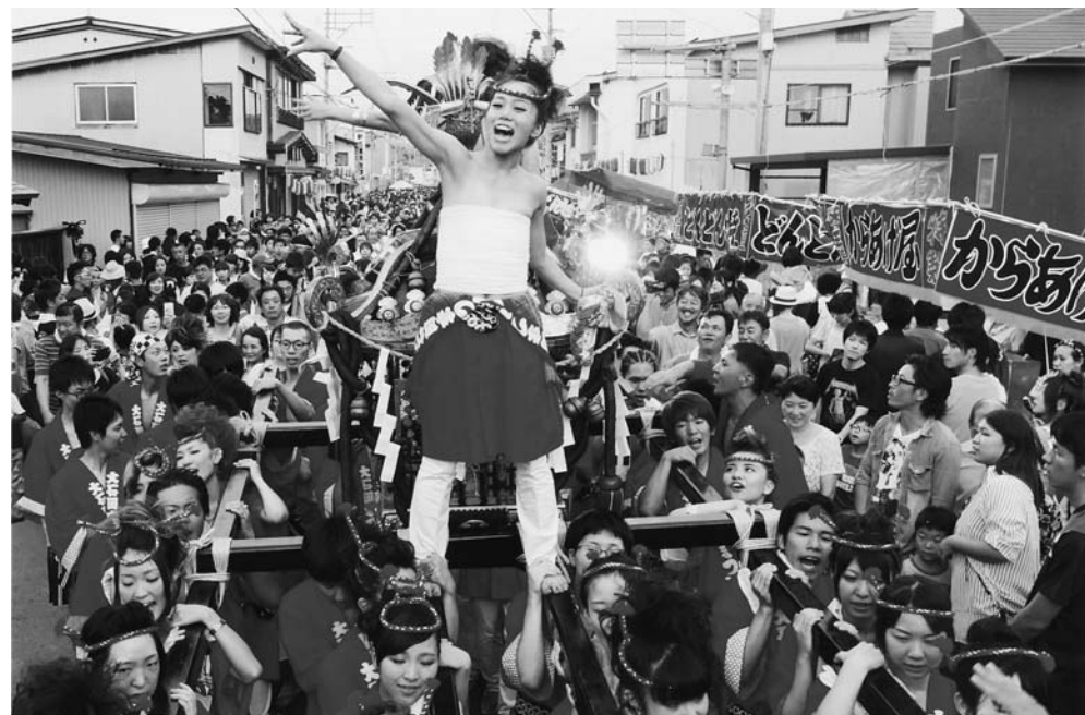
過去最高の人出(大石田まつり)

町 政一期四年間の総括は。町長 一番は何と言って交流センター建設を立ち上げたこと。公約の婚活事業の成果が出ないこと、見直していきたい。 中 学校部活、頑張っている一方で部員不足で新人戦に出場できない部があると聞くが対策は。教育長 ソフト部が出られない。どの部に入れないのは難しく大変苦慮している。何とかできないか学校側と相談したい。