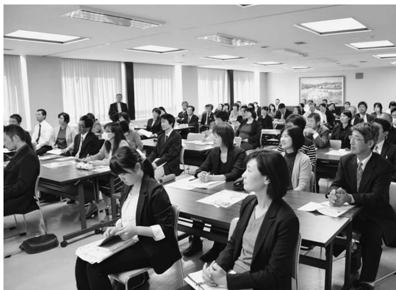
先生方も研修(教育講演会 10/9)

高 年齢が増えるのに老人クラブ会員が年々減り続けている。施策を講じるべきです。町長 役員・会長のなり手がいなくて減っているのが実状なので、社会福祉協議会と相談して対策を考えたい。 町 税込納率が3年で県内の下位から上位まで伸びてきた。職員の頑張りの評価すべきです。町長 2名の納税相談員と職員が一体となって徴収活動、口座振替、コンビニ収納の普及等、頑張り成果となっている。高く評価したい。