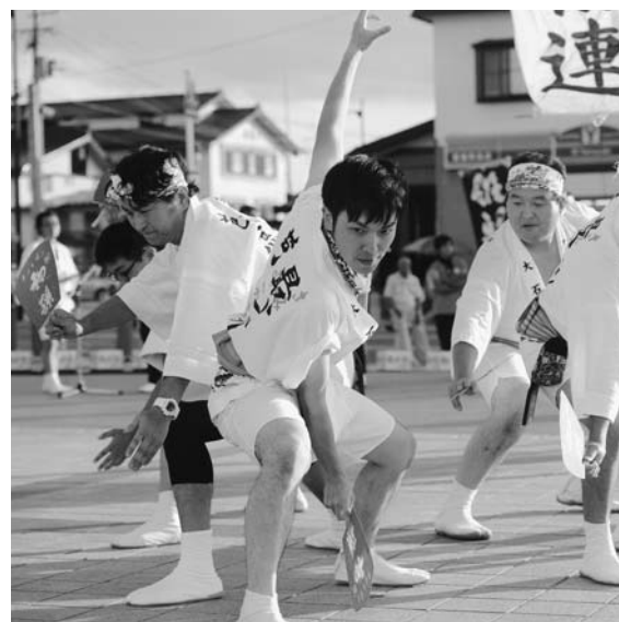
職員も大活躍(維新祭)

8 月15・16日のまつりに参加している職員を勤務扱いにすべきでは。総務企画課長 15日は10倍主催なので自主参加した。16日はまつり委員会主催なので勤務命令を出しての勤務となる。 町 民の森管理棟はぜひんぜん利用されていないのに修繕するのは町長 これれた物は直すべきとの考えで、割れたガラス窓だけ入れ替えた。