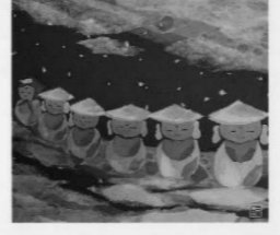
大石田どんとむがすの会