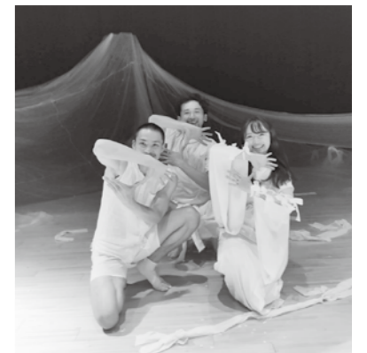
レテ公演後の写真。左側が私です。