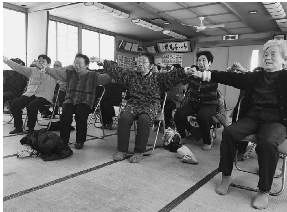
1月19日(木)に小菅公民館で開催された「いきいき百歳体操体験会」の様子。体験会の結果、小菅地区では1月26日から毎週木曜日、体操に取り組むことになりました。

広がる地域ぐるみの介護予防 地域における介護予防を進める「いきいき百歳体操」の取り組みが広がりをを見せています。 いきいき百歳体操は、寝たきり高齢者を減らそうと高知市で考案されたもので、大石田町では平成27年度から取り組んでいます。 当初、坂ノ上げんき会と朝日町老人クラブの2団体でスタートしましたが、このたび、上ノ原老人クラブや里地区などでも新たに取り組みが始まりました。その他にもいくつかの団体で取り組みを検討しており、さらに多くの地域へ広がろうとしています。