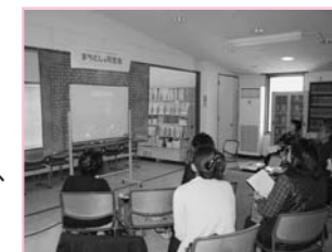
まちとしょ同窓会では、スライドを上映してこれまでの活動を振り返りました。