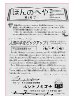
学校図書室だより「本のへや」創刊号