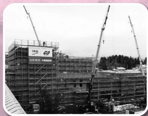
建設中の町民交流センター。愛称「虹のプラザ」に決定し、本年9月のグランドオープンに向けて、順調に工事が進んでいます。

新年明けましておめでとうございます。皆様におかれましては輝かしい新年をお迎えのことと心からお慶び申し上げます。 昨年は、全国各地で地震や台風の被害が続発する自然災害の多い年でありました。四月の熊本地方を震源とする地震をはじめ、鳥取県中部、福島県沖などで地震が多発し、甚大な被害に見舞われました。台風被害では、北海道や東北地方で大きな被害が発生しております。新たな一年が、災害のない穏やかな年となることを願っております。 さて、地方創生の実現に向けては「大石田町まち・ひと・しごと創生総合戦略」を策定し、基本的方向性を定めたところです。大石田町の創生には、町民の皆さんや各機関・団体、行政が一体となって、「オール大石田」として総意を結集し取り組むことが不可欠でありますので、皆さんからのご支援とご協力を改めてお願いいたします。