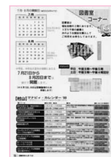
平成11年6月には広報おおいだの隔月刊「図書室コーナー」が始まりました