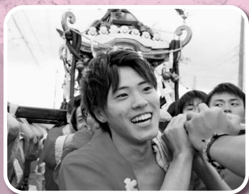
若者や女性が地域で活躍できる町づくりを進めます。