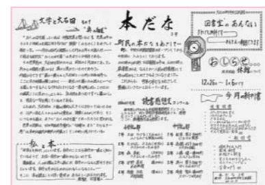
中央公民館図書室だより「本だな」第3号