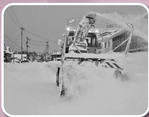
雪対策の強化や安全で安心感のある町づくりに引き続き取り組みます。