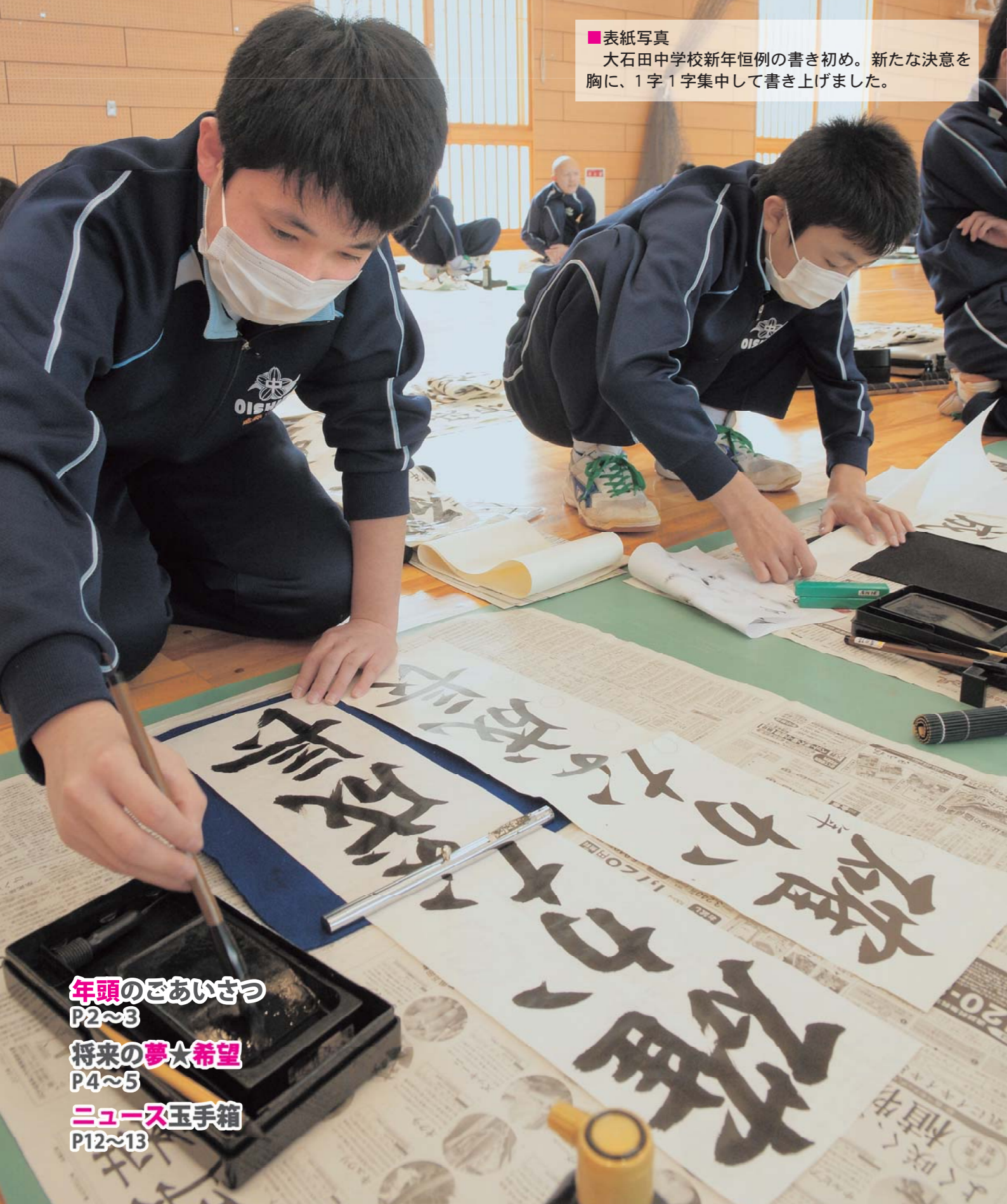
■表紙写真 大石田中学校新年恒例の書き初め。新たな決意を胸に、1字1字集中して書き上げました。

年頭のごあいさつ P2~3 将来の夢★希望 P4~5 ニュース玉手箱 P12~13