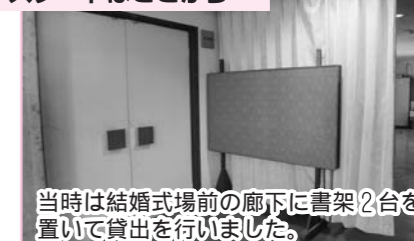
当時は結婚式場前の廊下に書架2台を置いて貸出を行いました。