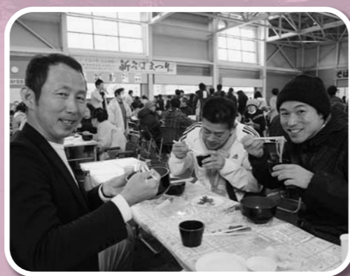
昨年の新そばまつり。大石田のそばをPRし、交流人口の拡大を図ります。