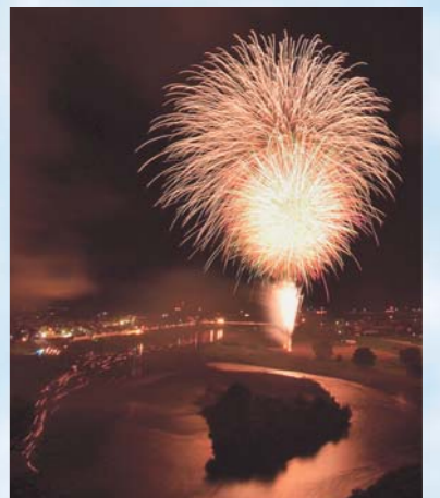
「夏の陣」おおいだ 近野 範夫(天童市)