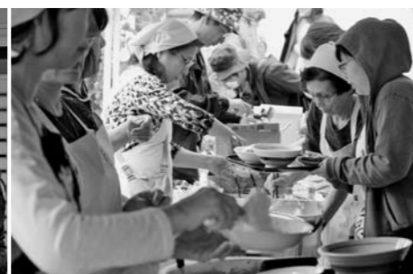
町内各地で行われた撮影。多くの町民がさまざまな役柄で撮影に参加しています。最終盤には、冷たい雨の降るなか食生活推進員のメンバーが昼食を振舞い、出演者とスタッフをねぎらいました。