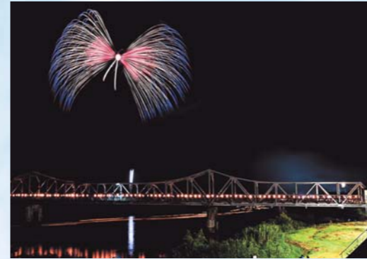
「大河の夏の蝶の舞」 樽石 良一(村山市)