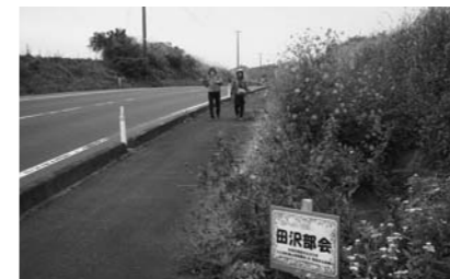
オレンジ色のコスモスが咲きほこる国道347号沿いを歩いて、田沢薬師堂へ。一部歩道のないところを歩くので注意が必要です。