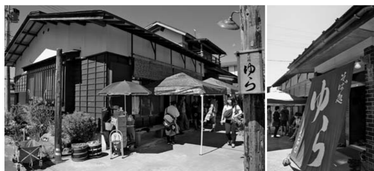
そば店「ゆら」のセット。空き家を改修して本物のそば店さながらのセットが作られました。