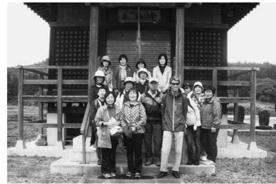
今回は大堤(田沢沼)をスタート地点に、参加者同士の会話を楽しみながら歩きます。

今回は10月6日(金)に行われたウォーキングイベント「おいしだまち歩き」で歩いた田沢地区コースを紹介합니다。当日は健康推進員や地域の方など16名が参加しました。