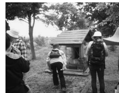
最後は大堤の三吉神社へ。今回はおよそ1時間で約4キロを歩き、歩数は約5,000歩でした。

町公式ホームページではマップと今回歩いたルートの詳細を紹介しています。トップページ「暮らし・手続き」から「福祉・健康」に進み、「ウォーキングマップ」をご覧ください。