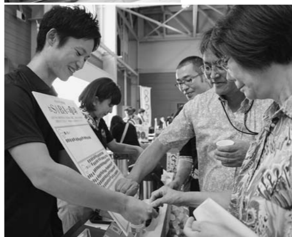
7月の「三街道そばの里まつり」でも試飲を実施。多くの方から「おいしい」と好評を得ました。

田オリジナルのブレンドコーヒーの開発を進めてきました。振興会では発売に向け、昨年の新そばまつりで訪れた方にそばとコーヒーの比率を変えた3種類のコーヒーを試飲してもらいアンケートを集めたほか、今年の5月からそば街道加盟店など試飲期間として提供。それらの意見をもとに来迎寺在来種に焙煎を加え、カフェパウリスタ担当者が厳選したブラジルコーヒー豆とブレンドし、蕎麦と珈琲、お互いの香りを邪魔せず引き立てあう、大石田オリジナルのそばブレンドコーヒーが完成しました。そばコーヒーは10月28日(土)以降、そば街道加盟店など町内15店舗で提供されます。お土産品としての販売、メニューとしての提供など店舗により提供方法や開始時期が異なりますので、詳細は町公式ホームページをご覧ください。