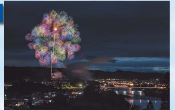
「彩色千輪」 森 茂(新庄市)