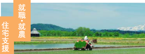
就職・就農 住宅支援